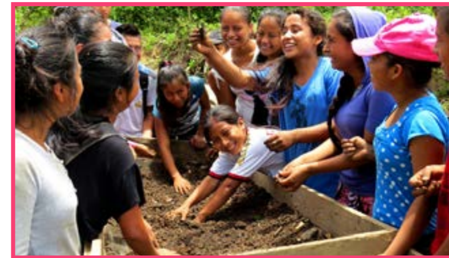
คำอธิบายภาพ: เด็กๆ พื้นฐานชาว Maya-Q'eqchi' ขณะเรียนรู้เรื่อง Permaculture และการฟื้นฟูพายุกรป่าผ่านกิจกรรมบูรณาการ